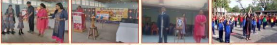
कक्षा पहली के नन्हें बालकों का स्वागत