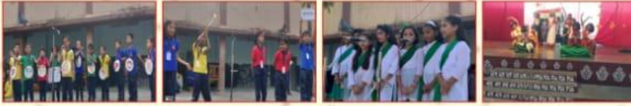
प्रार्थना सभा कार्यक्रम