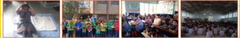
स्वस्थ बच्चे स्वस्थ भारत