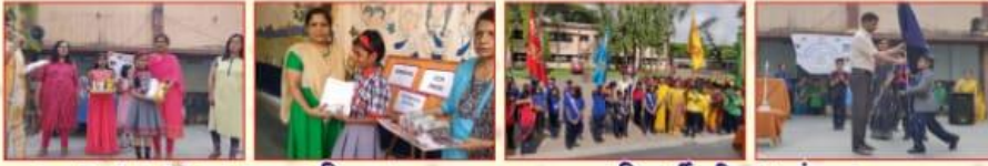
सत्र २०१८-१९ का पुरस्कार वितरण