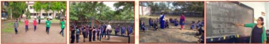
खेल क्लब संतुलन योग्यता का विकास